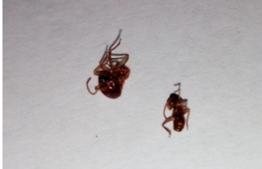
Gambar 3. Rayap Yang Sudah Mati

Perubahan tingkah laku pada hama setelah aplikasi adalah aktifitas makan yang menurun, pergerakan rayap menjadi lebih lambat, tubuh rayap menjadi kaku dan kemudian mati. Warna tubuh rayap berubah dari berwarna pucat menjadi warna kehitaman.