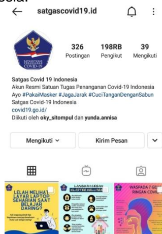
Gambar 1.2. Instagram Satgas Covid 19 Indonesia

Data gambar di atas menunjukkan bahwa media sosial Instagram merupakan media sosial ke-4 yang terbanyak digunakan oleh masyarakat dengan jumlah presentasi 79%. Instagram dengan beragam fiturnya yang memudahkan masyarakat mendapatkan informasi seperti informasi protokol kesehatan melalui tagar yang ramai digunakan oleh masyarakat seperti hashtag dan fitur share . Seperti #satgasCovid19 , #pakaimasker yang membuat informasi semakin meluas dan sebagainya, yang mana hashtag tersebut digalakkan langsung oleh Instagram Satgas Covid 19 Indonesia.