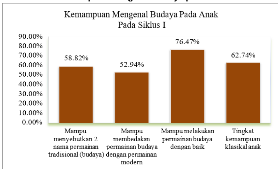
Grafik 2. Kemampuan Mengenal Budaya pada Anak Siklus 1

Dari hasil yang diperoleh pada siklus I diketahui bahwa tingkat kemampuan anak mengenal budaya sebesar 62,74% dan pencapaian ini masih belum sesuai dengan ketentuan yang diinginkan di mana dalam mengukur berhasilnya suatu tindakan atau hasil dari aktivitas kegiatan ditentukan sebesar 80%. Di samping itu, nilai 62,74% jika diukur dengan kriteria pencapaian secara klasikal berada pada interval 61-80% dengan kriteria "Baik". Selanjutnya untuk melihat gambaran hasil kemampuan mengenal budaya anak pada siklus I dapat dilihat pada grafik di bawah ini: