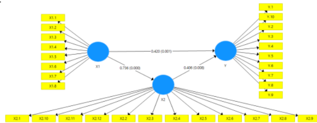
Gambar.2 Efek Mediasi

Secara grafis ringkasan hasil dari pengaruh langsung (Direct Effect) dapat dilihat pada gambar.2.